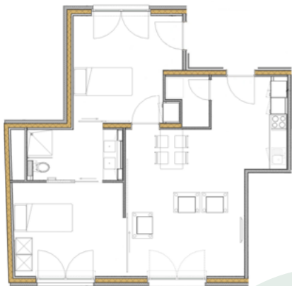
Grondplan van een rusthuisappartement